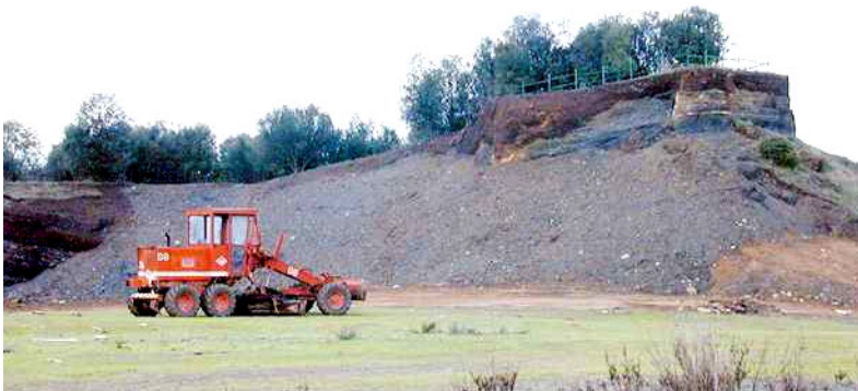
Pedrera Can Guilloterres, vista general. Actualment s'estan duent a terme diferents tasques de restauració.