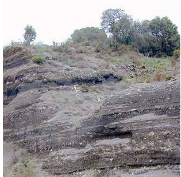
Pedrera de Can Costa. Es poden veure els diferents dipòsits piroclàstics que formen el con volcànic.