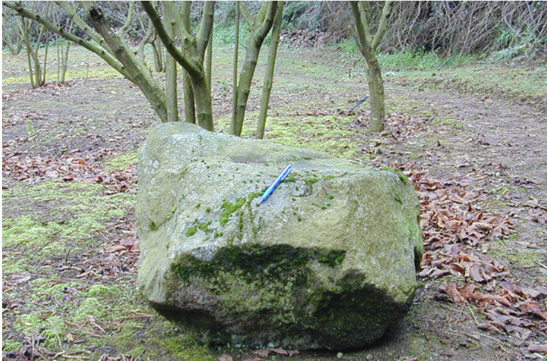
Fragment granític d'ordre mètric arrossegat pel volcà. Camp d'avellaners de Can Costa.